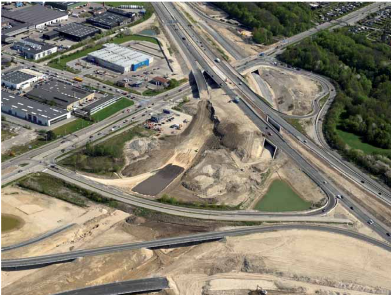
Motorvejskrydset ved Jyllingevej mellem Frederikssundmotorvejen og Motorring 3. Til sommer lægges asfalten og flere ramper åbner.