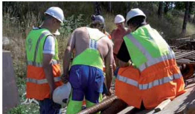
Arbejdet på M3 og Frederikssundmotorvejen har god fart på, så vi kan åbne de to veje i henholdsvis 2011 og 2012.

Hvad angår Frederikssundmotorvejen, så forventer vi - hvis det nuværende arbejdstempo holdes - at bilisterne kan køre på den nye strækning mellem